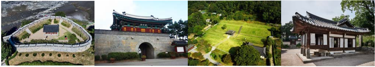
병인양요, 필사의 방어전 전개 초지진 신미양요, 가장 치열했던 격전지 광성보 고려, 실낱같은 운명을 지킨 궁터 고려궁지 19세기 조선 왕권의 실상 용흥궁

뚜껑 없는 박물관, 강화도는 한반도에서 네 번째로 크고 중요한 ‘섬’입니다. ‘시련과 좌절, 영광과 희망의 자취들이 곳곳에 서려있기 때문입니다. 안팎에서 격변의 파도가 다시 밀려오고 있는 오늘! 강화도에 서면, 우리의 현재와 미래, 일본의 과거와 중국의 미래가 ‘한 눈’에 보입니다.