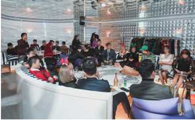
(원우회 주관) 송년의 밤