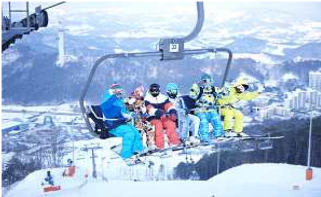
(원우회 주관) 스키 캠프