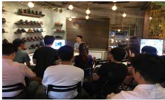
맨솔 신발연구소 쇼룸