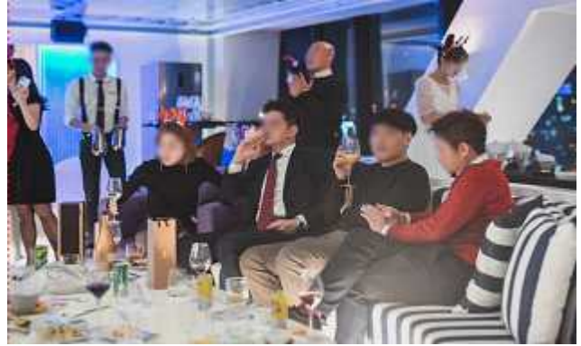
(원우회 주관) 송년의 밤